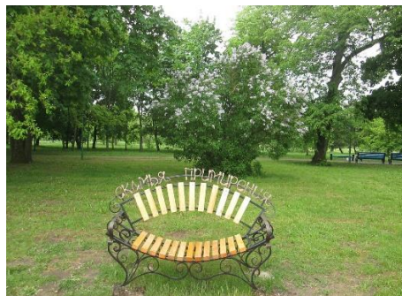
Der museums-Gutshof „Prushanski Palazik“, das Denkmal für die verbrannten Dörfer, die Alexander-Newskij Kirche, die Skulpturkomposition „Mucha und Wez“, die alten Handelsreihen, die Versöhnungsbank im Stadtpark