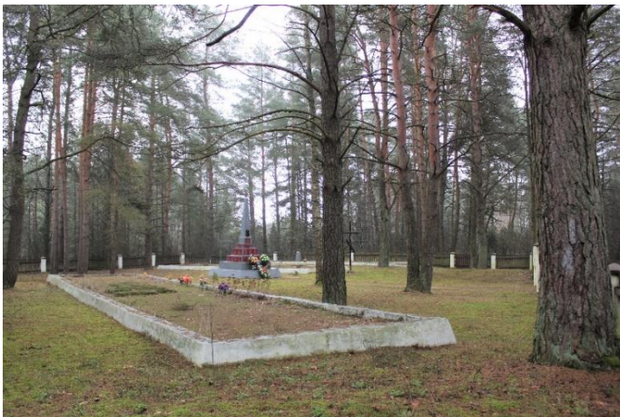
Магіла ахвяр фашызму. в.Краснае, Мокраўскі сельсавет. 11.03.2021.