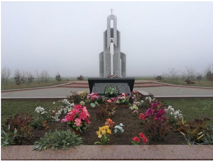
Магіла ахвяр фашызму. в.Казлы, Мокраўскі сельсавет. 11.03.2021.