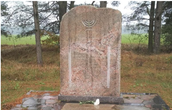
Памятны знак ахвярам Халакосту. в. Мыльніск. 24.10.2020.

Звесткі аб знішчаным у гады вайны насельніцтве г. Пружаны, г.п. Ружаны, г.п. Шарашова. Сяр. 1940-х гг. (з фондаў Музея-сядзібы “Пружанскі палацык”)