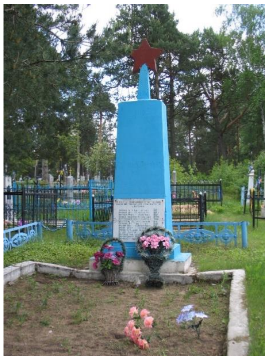
Магіла ахвяр фашызму. в.Куляны, Ружанскі сельсавет. 2018.