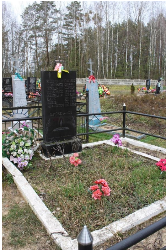
Магіла ахвяр фашызму. в.Клятное, Сухопальскі сельсавет. 10.03.2021.