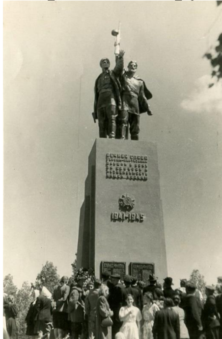
Могілка савецкіх воінаў і партызан ва ўр.Гута-Міхалін (Івацэвіцкі р-н). 1960-я гг.