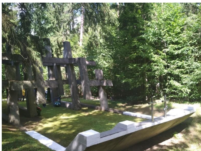
Магіла ахвяр фашызму ў Белавежскай пушчы. 01.08.2020.