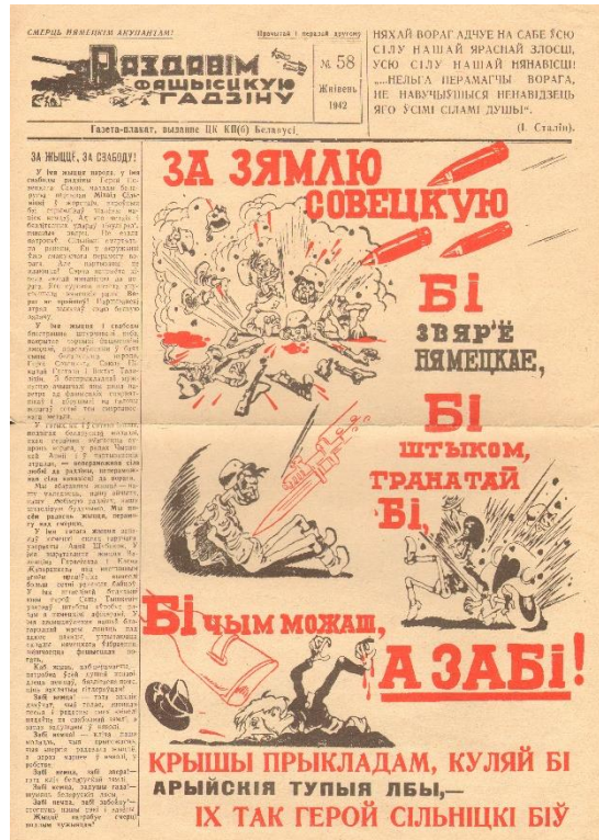
Копія партызанскай газеты-плаката “Раздавім фашысцкую гадзіну”. Жнівень 1942 г.