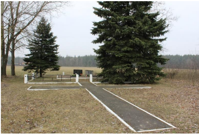
Магіла ахвяр фашызму. г.п.Шарашова. 10.03.2021.