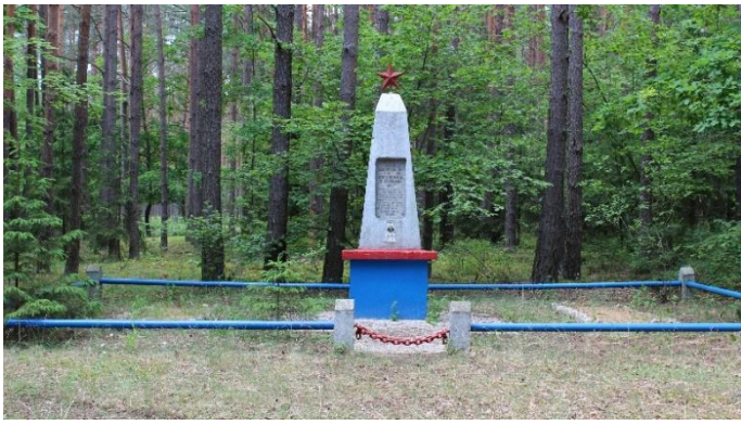
Магіла партазан атрада імя Суворова брыгады «Савецкая Беларусь», якія загінулі ў верасні 1943 г. ур.Ельня, Хараўскі сельсавет. 2019.