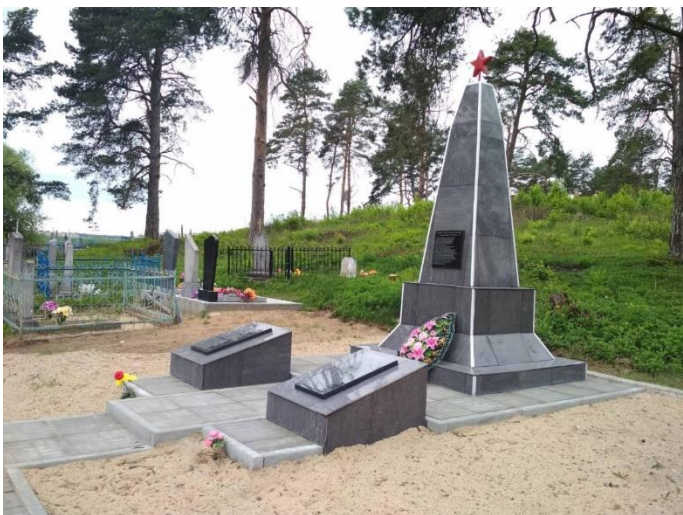
Магіла ахвяр фашызму. в.Манчыкі, Ружанскі сельсавет. 08.05.2020.