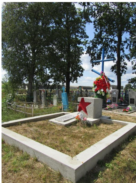
Магіла ахвяр фашызму. аг.Мурава, Сухопальскі сельсавет. 11.08.2021.