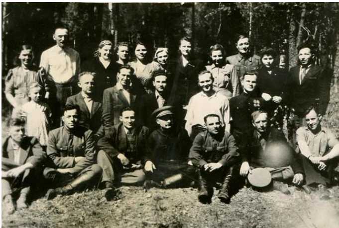
Партызаны атрада імя Кірава з жыхарамі в.Козі Брод. 1944 г.